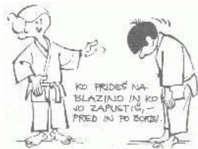
stoje – tachi rei